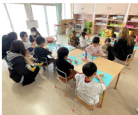
ハロールーム⑧(1月18日) 小麦粉を使って“はじめての粘土”