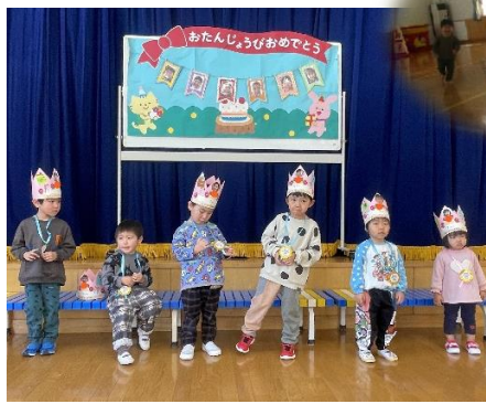
1・2月 お誕生会(1月24日) お楽しみ会は、パネルシアターとだるま運びゲームでした!