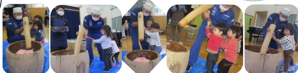
桃組・楓組(1歳児)のお友だちは、園では初めてのもちつき。