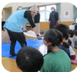
つきたての「おもち」を見せてもらいました。

オヤジの会のお父さん方と一緒にきねを持っておもちをついたり、松組のお母さん方と一緒にできたてのおもちを丸めたりして、昔ながらの伝統行事に親しみ、おもちの感触やできあがるまでの工程と一緒に楽しみました。昨年できなかった分も、元気に「よいしょ〜!」威勢のいい掛け声に、寒さも吹き飛ばす楽しい一日になりました。