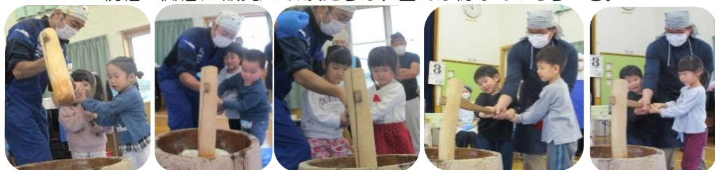
オヤジの会のお父さん方と一緒に「よいしょ〜!よいしょ〜!」の掛け声でもちをつきます。