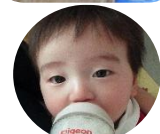
「僕はまだミルク。いっぱい飲んで大きくなるよ!」

お土産用の紅色のおもちを見た楓組のお友だち。きれいなピンク色のおもちにテンションMAX!!