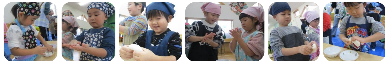
つきたての真っ白なおもちを小さくちぎって丸めます。柔らかくて温かいおちは気持ちがいいね!