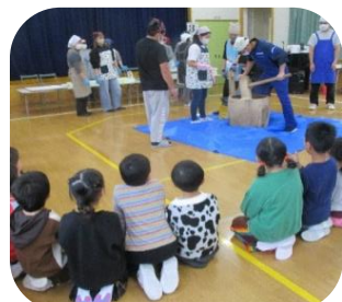
これから始まるもちつきにドキドキ!

2学期の大きな行事を経験して、子どもたちはたくましく成長しました。しかし冬休みに入ると、今まで身につけた生活習慣が乱れがちです。休み中も早寝・早起き、食事は3食食べる、排便をする、歯磨きをする、手洗いうがいをするなど規則正しい生活を心がけましょう。