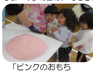
「ピンクのおもち かわいい♡」

お土産用の紅色のおもちを見た楓組のお友だち。きれいなピンク色のおもちにテンションMAX!!