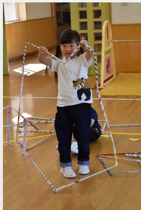
特大ハートと特大おさかな