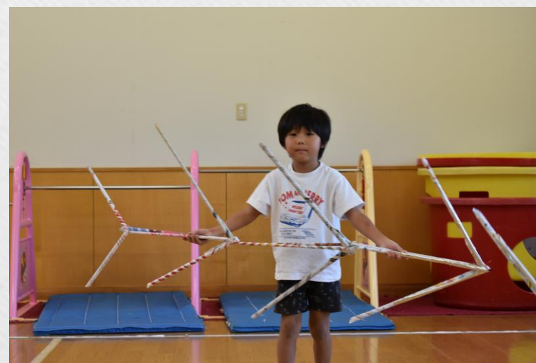
「げんかんはこっちだよ!」のかんばん!