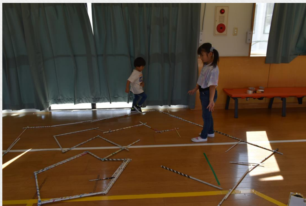
特大めいろ 考え中・・・