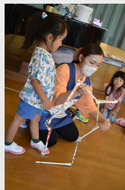
だいすきな恐竜をつかったよ！