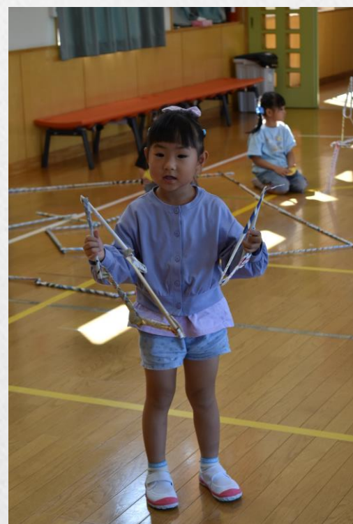
△さんかくとハートをつくりました！