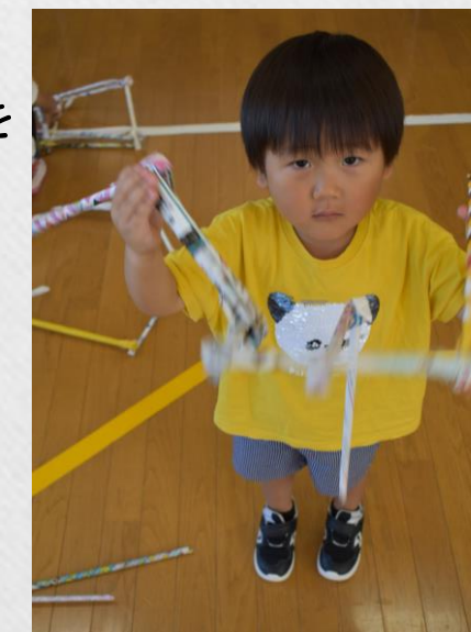
ゆらゆらうごくのを つくったよ！