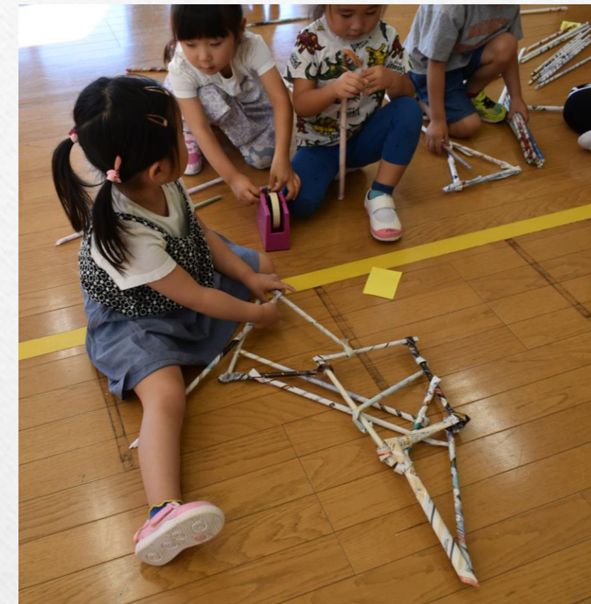
黙々と自分のイメージを形にする子も・・・ 素敵な作品を製作中