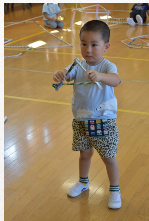
つなげるって面白い！