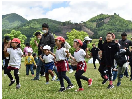
春の親子遠足(5月25日) 2～5歳児参加。お天気も良かったです。