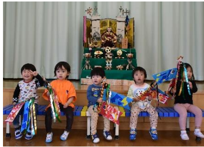
こどもの日集会(5月2日) 製作したこいのぼりも持ち帰りました。