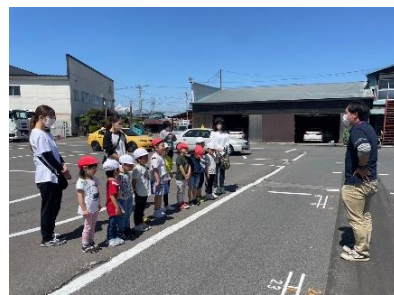
交通安全教室(5月15日) 4～5歳児参加(黒石自動車教習所)