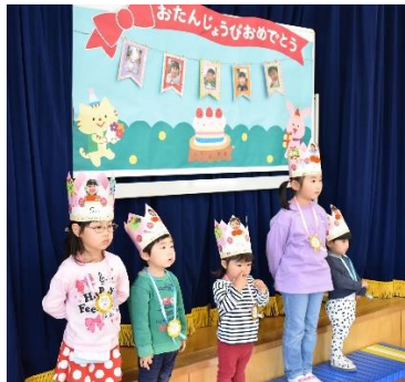
4・5月 お誕生会(5月17日) お楽しみ会は、フルーツバスケットでした!