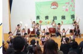
七五三おゆうぎ会