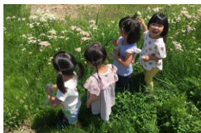
自然に囲まれた環境